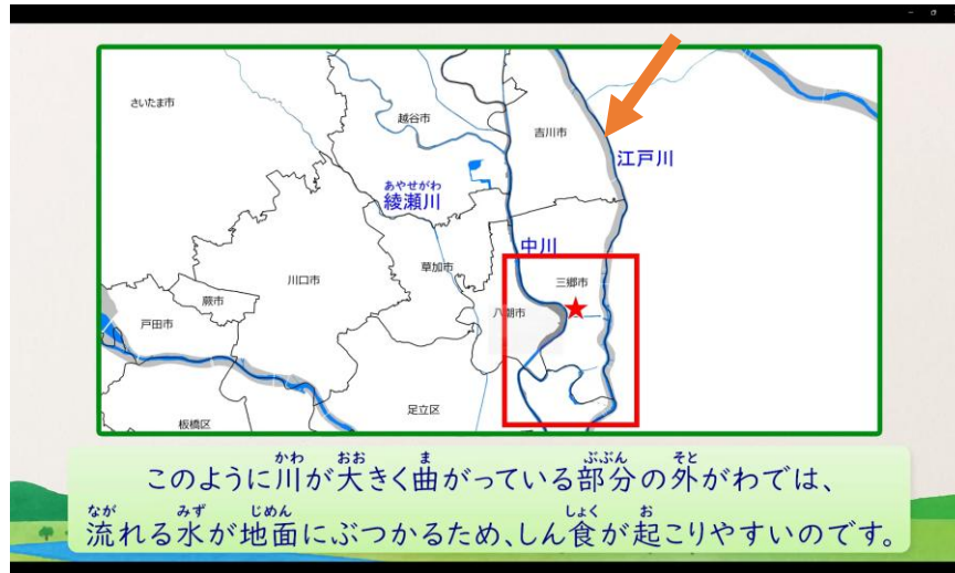
図3: 動画中の地図にある河川区域