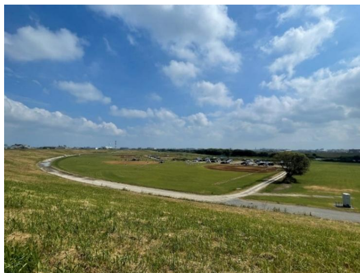
図2：サンケイスポーツセンター